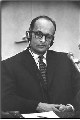
« The Führer has ordered the extermination... Adolf Eichmann