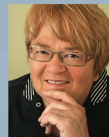
Sous la direction de Francine Chicoine