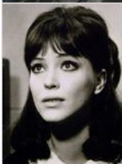
Anna Karina , Catherine