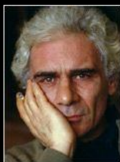
Gian Maria Volonte , Zénon Ligre

Réalisé par : André Delvaux Reprise : 2010 - Sortie : 1988 Genre : Drame Durée : 1h48 Nationalité : française, belge Nominations (6) : Cannes 1988